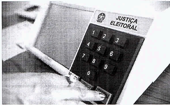
Militares querem acessar informações dentro do ambiente fornecido pelo tribunal às entidades de fiscalização

Em paralelo, o tribunal criou um projeto-piloto para entregar estas informações a algumas entidades fora das dependências da corte. Foras selecionadas para este tipo de análise a PF, a UFPE (Universidade Federal de Pernambuco) e a Unicamp (Universidade Estadual de Campinas). Procurados, TSE e Ministério da Defesa não se