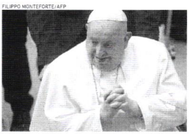
ESTADO É "CRÍTICO, MAS ESTÁVEL"

O estado de saúde do papa Francisco, que sofre de uma pneumonia nos dois pulmões, "continua crítico, mas estável", informou o Vaticano na noite ontem, 25, no 12º dia de hospitalização, ressaltando que o pontífice, de 88 anos, havia trabalhado durante o dia. "O estado clínico do Santo Padre continua crítico, mas estável", indicou a Santa Sé em um breve comunicado, no qual acrescentou que "o prognóstico permanece reservado". (AFP)