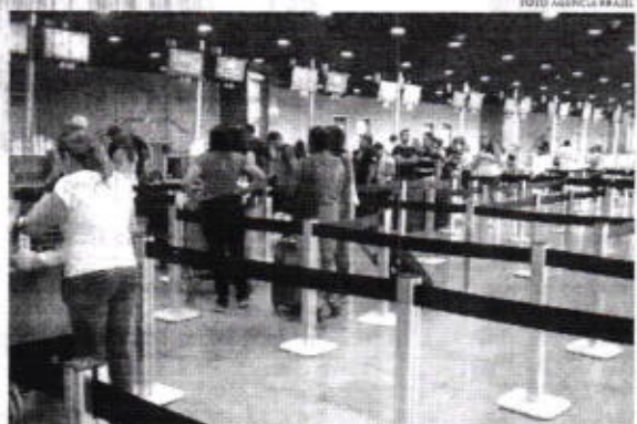
O levantamento mostra a força das vendas de viagens para datas ao longo do ano

Sorte lançado. A Mega da Virada 2023 deve pagar R$ 570 milhões, o maior prêmio da história do concurso especial, para quem acertar as seis dezenas. As apostas estão abertas desde o dia 13 de novembro e o sorteio será realizado em 31 de dezembro. O sorteio será realizado também no dia 20h.