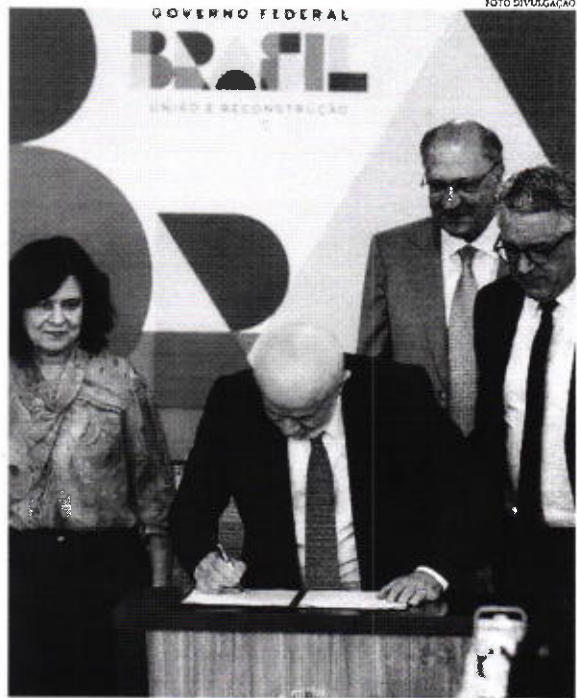
Presidente Lula sanciona o Projeto de Lei, que regulamenta a profissão de sanitarista

Reconhecimento O deputado federal Jorge Solla (PT-BA) que é médico sanitarista e foi um dos relatores da ma-