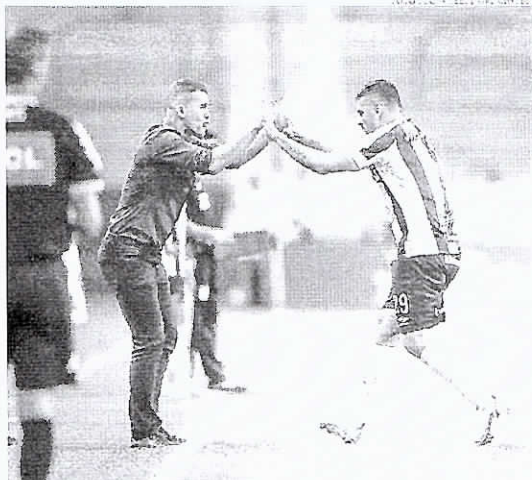
O desfecho da partida deu fôlego para o Grêmio na luta contra o rebaixamento para a série B do nacional

Com 33 segundos, isso mesmo: minutos de um minuto de bola rolou no Grêmio e azeite e travessão. Além disso, o time mostrou enorme austeridade para sacar o Fluminense na saída de bola. O ritmo, entretanto, tinha claro prazo de validade. O tempo jogado mais raro e as chances passaram a ser mais raras.