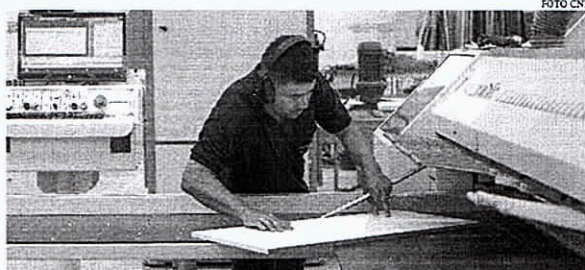
Índice de Situação Financeira das Pequenas Indústrias alcançou 42,3 pontos

A falta ou o alto custo de matéria-prima se manteve