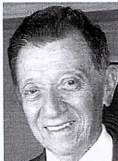
CIRCULO MILITAR General Souza, tomará posse no dia 12/06 como Presidente do Circulo Militar de Fortaleza.