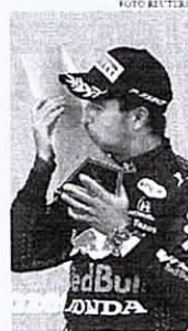
Mexicano aproveitou relargada após bandeira vermelha e venceu prova.

e passou reto. Sebastian Vettel, com brilhante jornada com a Aston Martin, foi o segundo colocado, subindo assim ao lado justamente do seu sucessor na equipe de Silverstone, enquanto Pierre Gasly, outro com um domingo excepcional com a AlphaTauri, completou o improvável podio deste domingo em Baku. Charles Leclerc, pole position da corrida, chegou a travar batalha com Gasly no fim da corrida, depois da relargada, mas terminou em quarto lugar, fechando à frente da McLaren de Lando Norris. Fernando Alonso conquistou seu melhor resultado no regresso à Fórmula 1 e foi o sexto com a Alpine, à frente da AlphaTauri de Yuki Tsunoda. Carlos Sainz foi o oitavo com a Ferrari, sendo seguido por Daniil Kvyat e Kimi Räikkönen. No fim das contas, os dois protagonistas do campeonato saíram zerados. Verstappen, em razão da batida que culminou no abandono da corrida, e Hamilton pelo erro no fim da prova. O heptacampeão terminou apenas em P15. Foi a primeira vez desde o GP da Áustria de 2018 que Lewis não terminou uma corrida na zona de pontuação. Um hiato de 55 GPs.